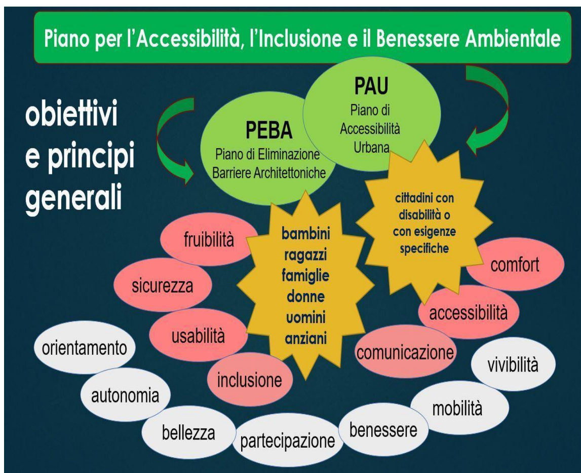
Fig. 1 – Obiettivi e principi